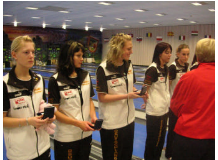
Ehrung für die deutschen Mädchen.