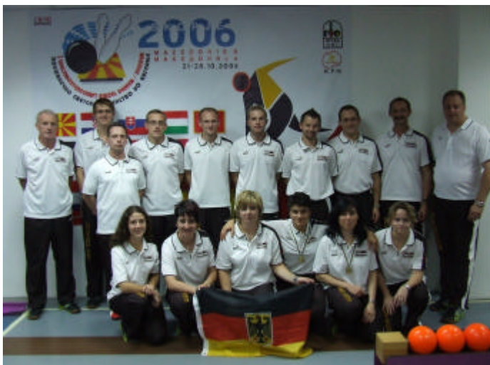
Die deutsche Delegation bei der WM 2006 in Skopje / Mazedonien