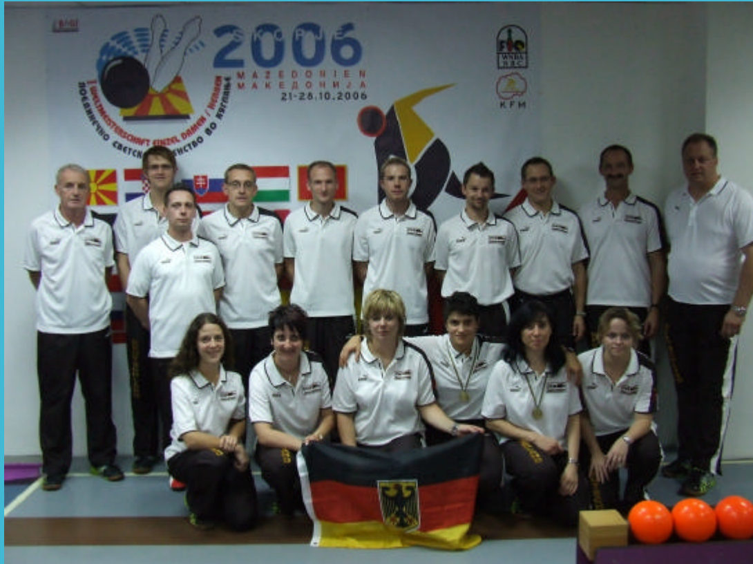
WM-Team Deutschland 2006