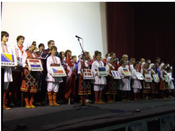
Eröffnungsfeier im Kino Milenium