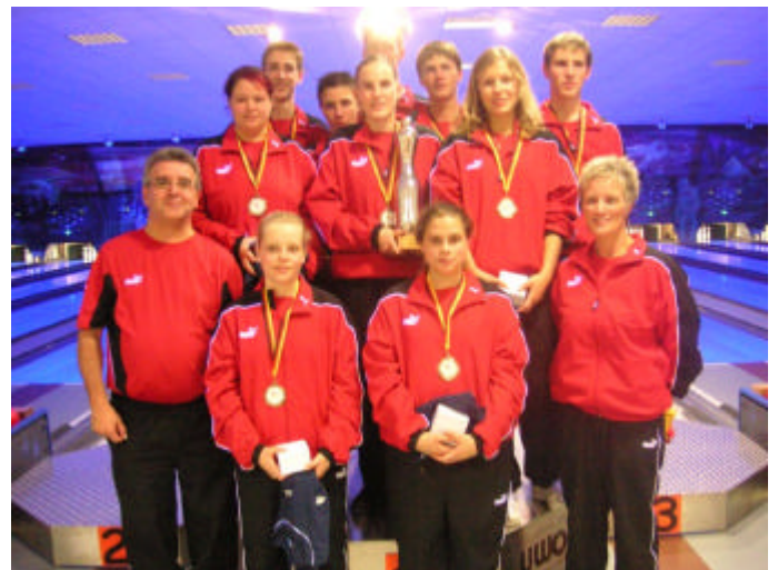
Die Auswahl von Württemberg wurde Sieger des A-Jugend-Ländervergleiches.