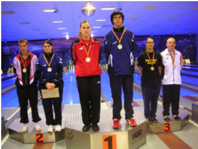
Die Sieger des Einzelwettbewerbes.