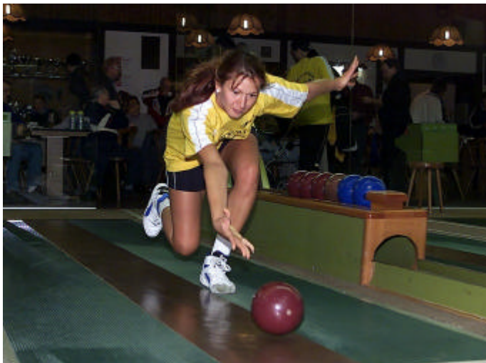
Perfekter Bewegungsablauf einer Weltklassekeglerin.