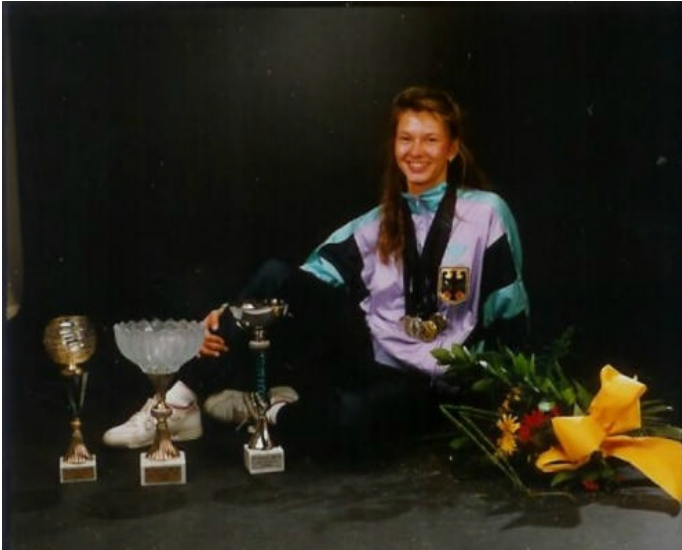
Pokal und Medaillen sind ihr Steckenpferd.

Hut bringen können, und jetzt sagt sie, dass man „mit zwei Kindern einfach managen muss.“ Da bleibt neben den vielen Aufgaben höchstens noch manchmal Zeit für ein bisschen Skifahren.