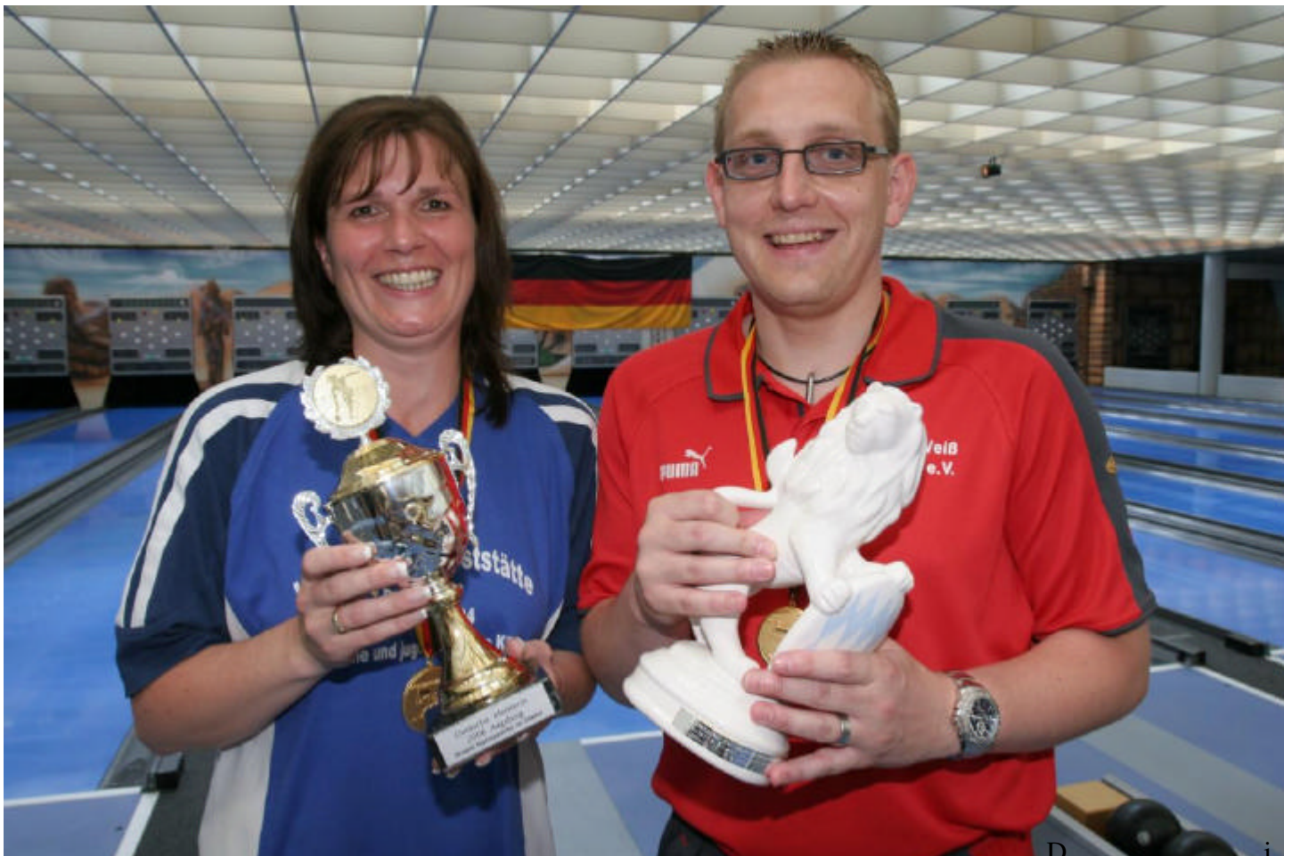
Die beiden Sieger der deutschen Einzelmeisterschaften vertreten Deutschland beim Einzel-Weltpokal.

Größte Erfolge: WM-Bronze im Einzel 2006 in Skopje Mannschafts-Weltmeister 2005 in Novi Sad Dreifacher deutscher Einzelmeister Mehrfacher deutscher Mannschaftsmeister Mehrfacher Mannschafts-Weltpokalsieger